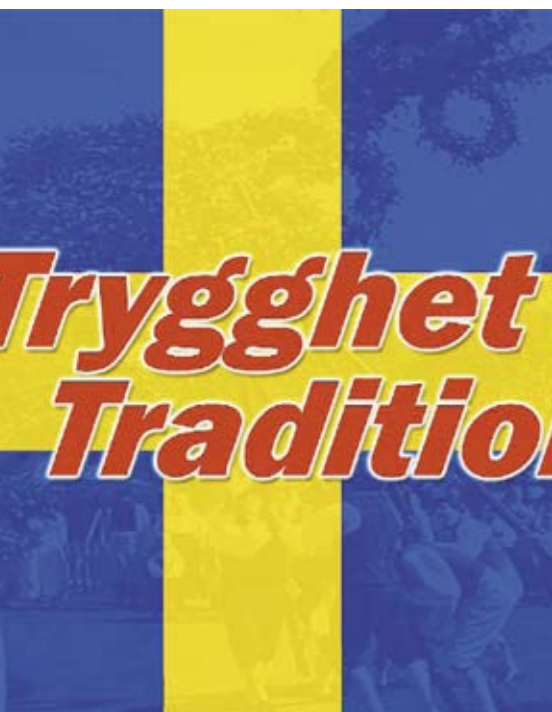
bild: Sverigedemokraternas flygblad 2007