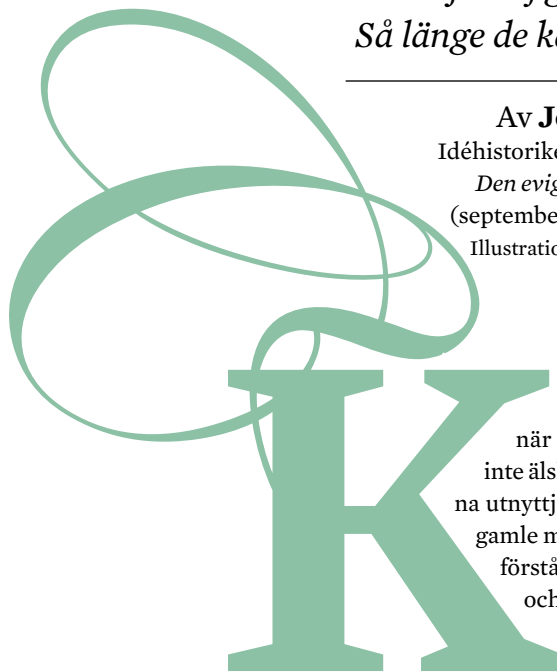
Illustration av Joanna Andreasson

K ING LEAR BORDE ALDRIG ha delat upp kungariket mellan sina två äldsta döttrar när han fick för sig att den yngsta, Cordelia, inte älskade honom. De intrigerande arvtagerskorna utnyttjade nämligen sin nya makt till att jaga den gamle mannen på flykt, under vilken han förlorade förståndet. De båda systrarna blev rivaler i kärlek och den ena mördade den andra och tog sedan sitt eget liv. Den man de båda älskade avrättade Cordelia, som egentligen var den som älskade fadern – som dog av sorg.