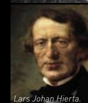
Lars Johan Hierta.